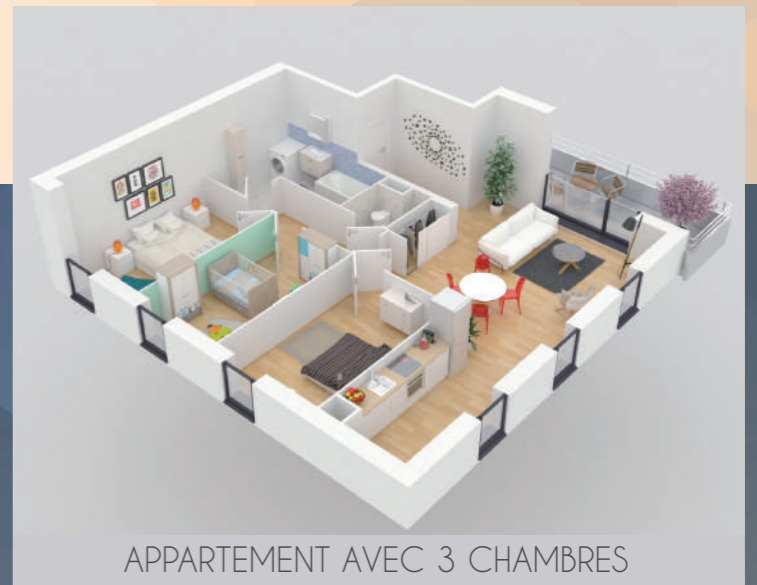
APPARTEMENT AVEC 3 CHAMBRES